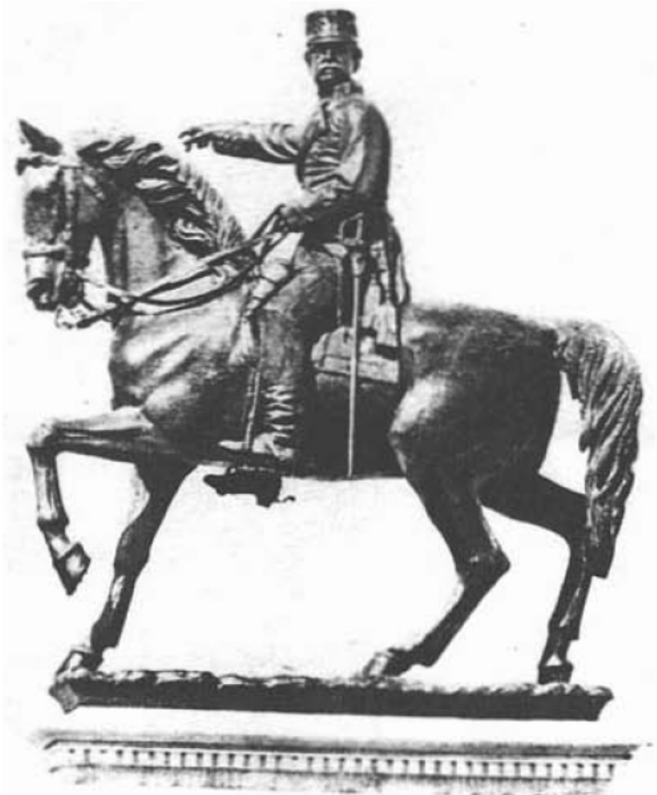
Fig. 2. Estatua ecuestre del Marqués del Duero. Obra de Andrés Aleu y Teixidor.