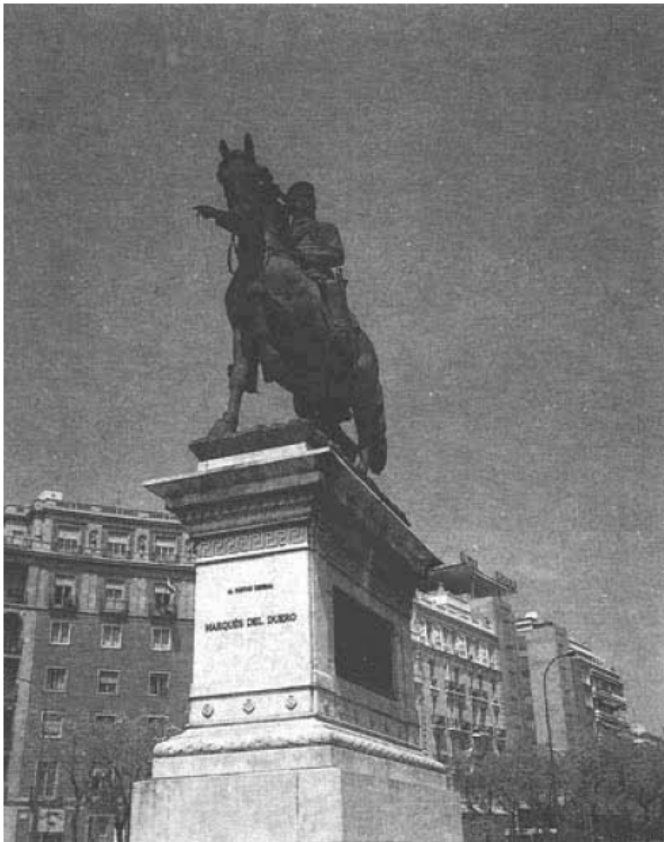
Fig. 1. Monumento ecuestre del Marqués del Duero. Obra de Andrés Aleu y Teixidor. Paseo de la Castellana. Madrid.

Con respecto a la actitud del caballo, la comisión redactó en este programa su deseo de evitar que fuese colocado a galope o en corveta, anotando a continuación claros ejemplos de escultura ecuestre en la cual se manifiestan actitudes no arrogantes como la estatua ecuestre de Marco Aurelio en el Capitolio, la de los hermanos Balbos encontradas en las excavaciones de Herculano y conservada en el Museo Nacional de Nápoles, la estatua ecuestre del condottiero Gattamelatta en Padua, obra de Donalello; las de los duques de Toscana Cosme I y Fernando I obras de Bolonia levantadas en Florencia; las de Alejandro y Ranuccio Farnesio, obras de Mocchi que se erigen en la plaza de Piacenza; la de Luis XIV que modeló Girardon en París, para la plaza Vendome; la del duque Manuel Filiberto de Saboya, y la del rey Carlos Alberto que hizo Marrochetti para Turín; la del emperador José II que hizo Zanner en Viena; la de Napoleón levantada en Cherbourg y la de tantos ejemplos de estatuas ecuestres de emperadores, reyes y príncipes fundidas en bronce, entre las cuales destacan la de Federico el Grande en Berlín y la del emperador Nicolás I en San Petersburgo de claro aliento romántico (3).